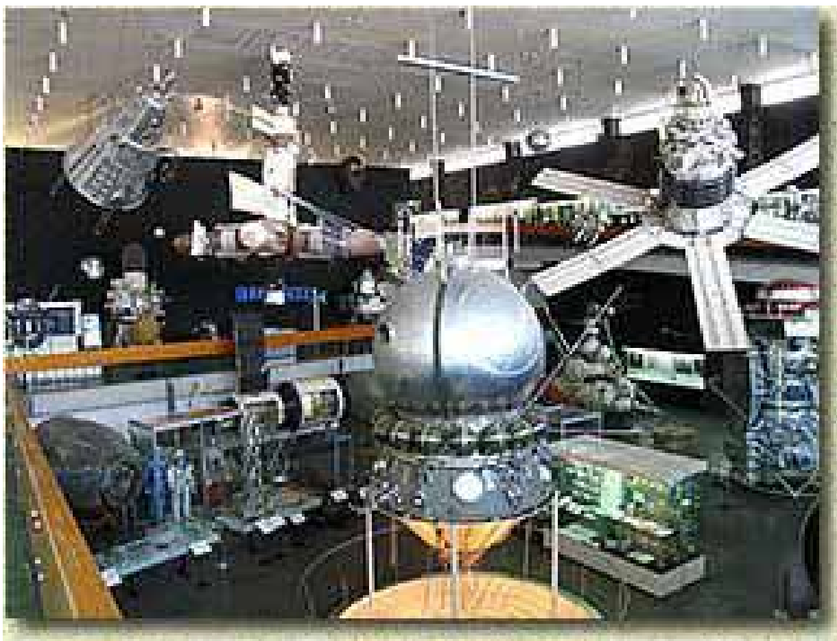
Экспозиции космической техники в зале ГМИК им. К.Э. Циолковского