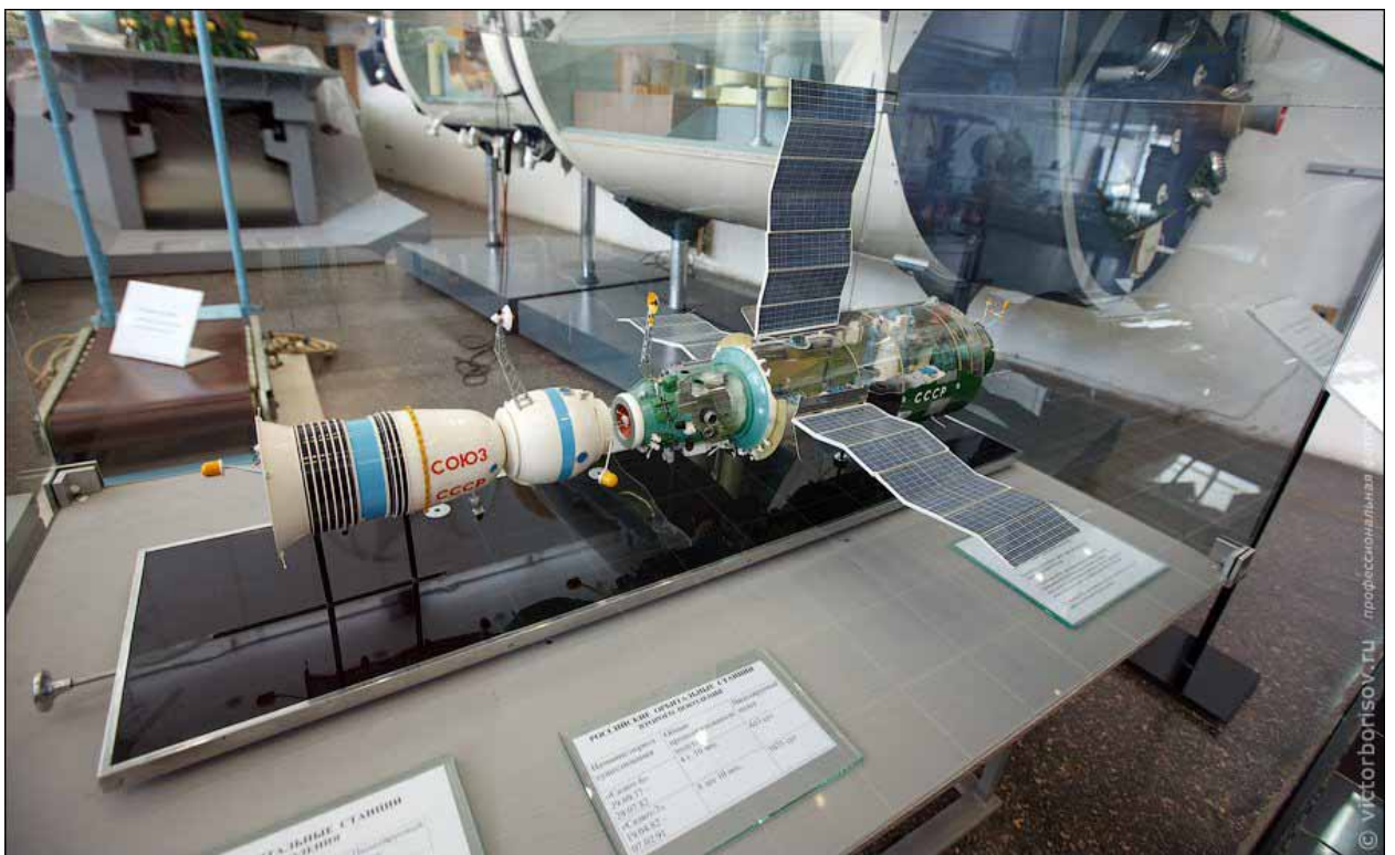
Макеты космической техники (ГМИК им. К.Э. Циолковского)