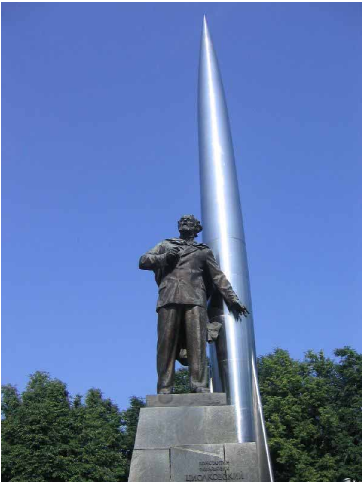
Памятник К.Э. Циолковскому в Калуге