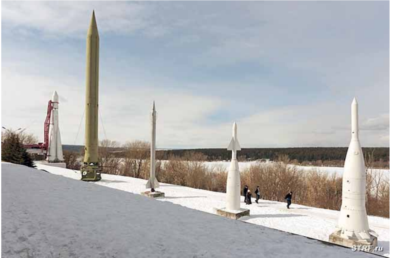
Отечественные космические ракеты двойного назначения – у здания ГМИК им. К.Э. Циолковского