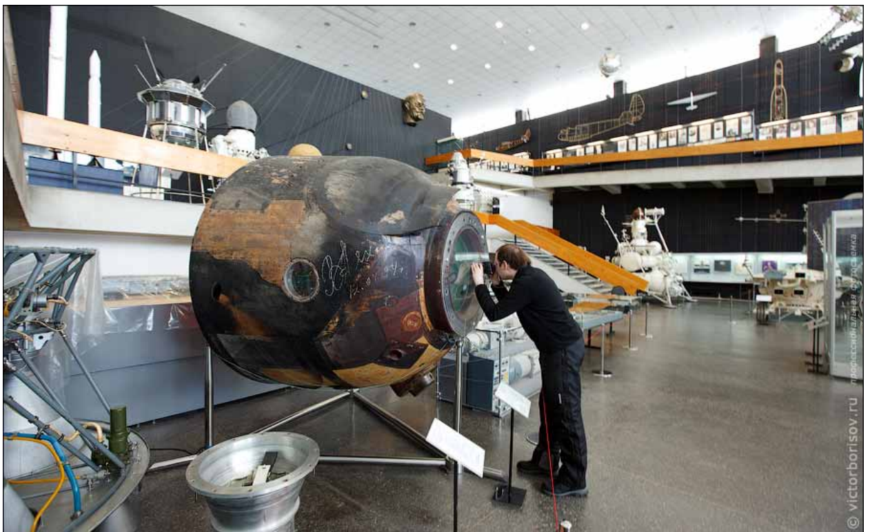
Спускаемый с орбиты аппарат (ГМИК им. К.Э. Циолковского)