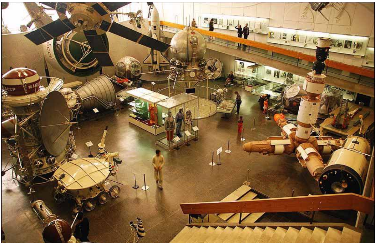
В зале ГМИК им. К.Э. Циолковского с новыми экспонатами космической техники (вид сверху)