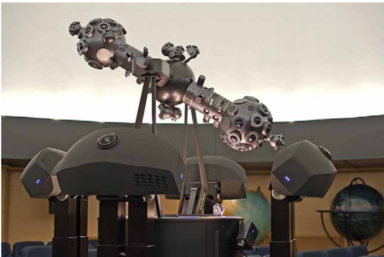
В зале планетария (ГМИК им. К.Э. Циолковского)