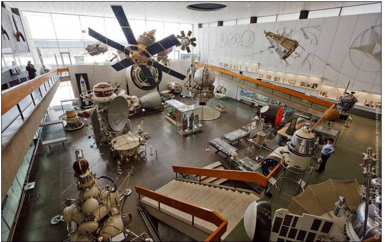
В зале ГМИК им. К.Э. Циолковского (вид сверху)