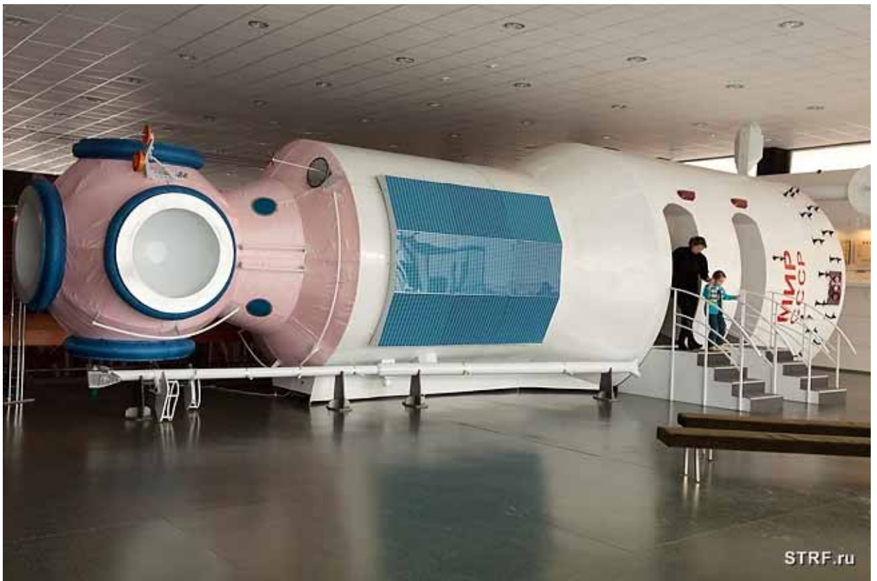
Копия (макет) космической станции «Мир» (ГМИК им. К.Э. Циолковского)