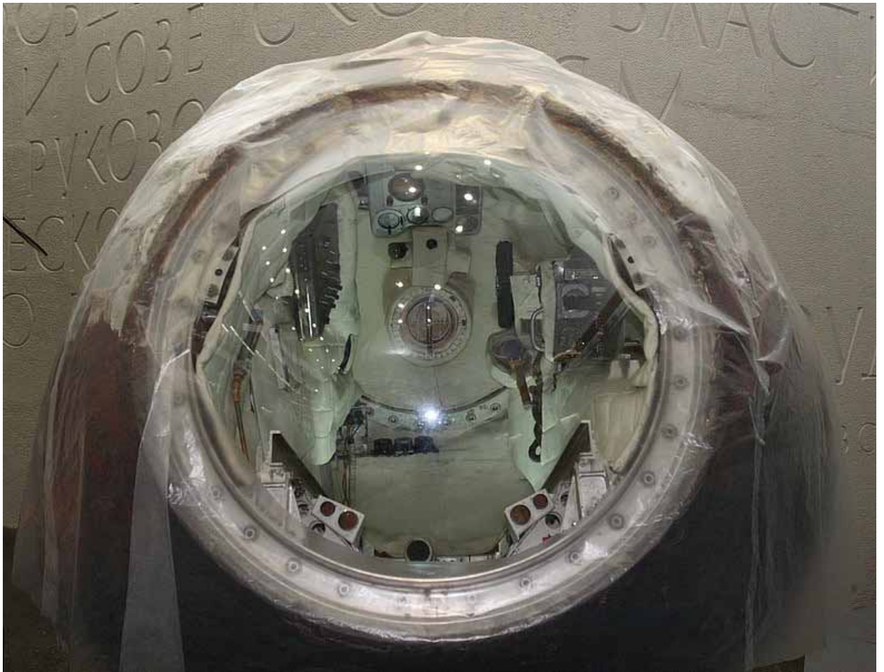
Приборы внутри спускаемого аппарата (ГМИК им. К. Циолковского)