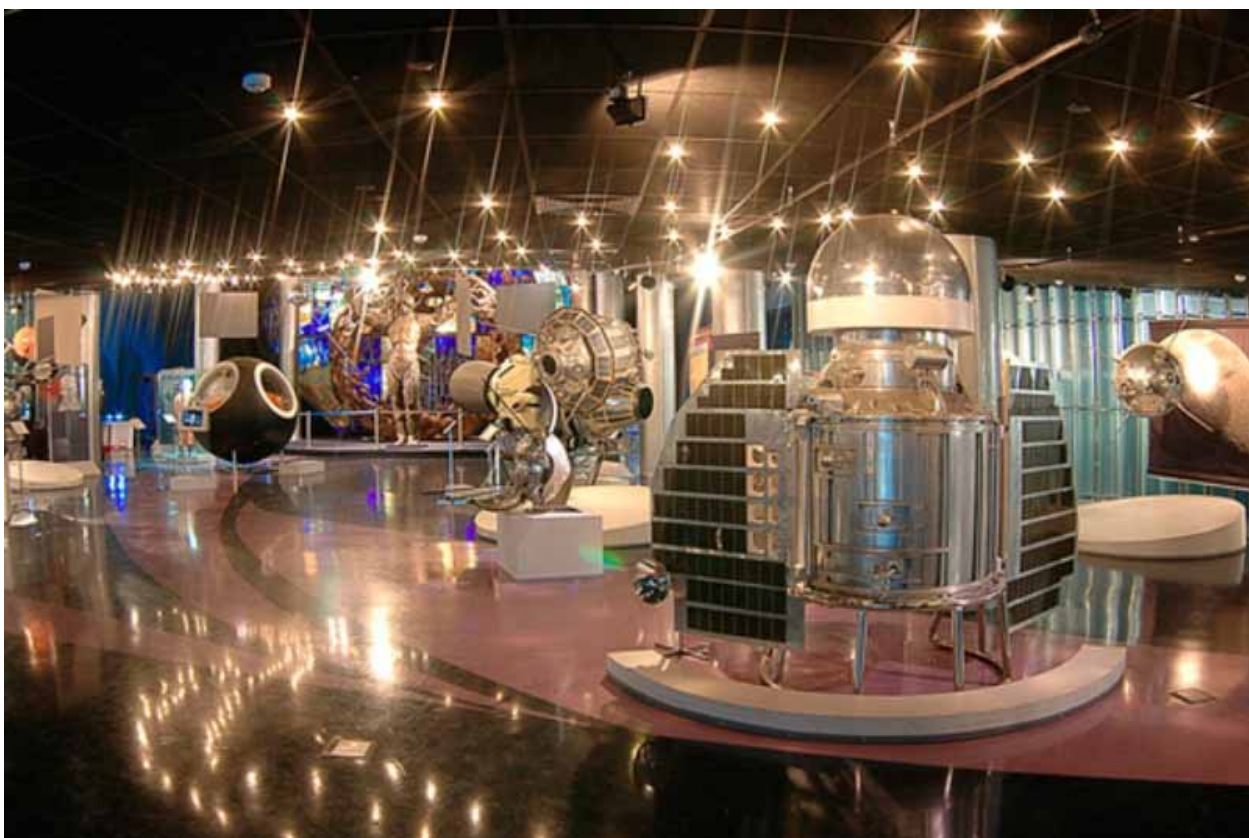
Новые экспонаты космической техники (ГМИК им. К.Э. Циолковского)