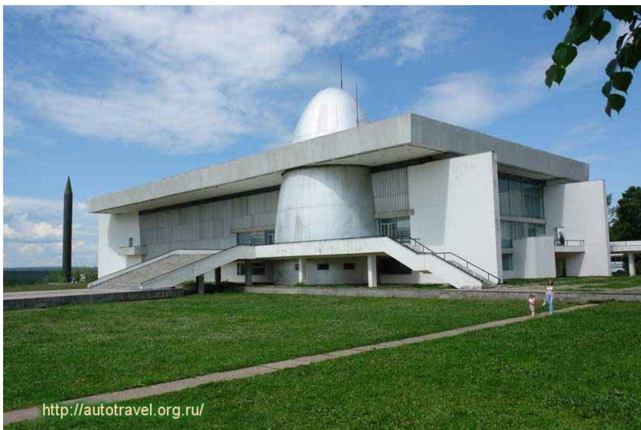
ГМИК им. К.Э. Циолковского в Калуге