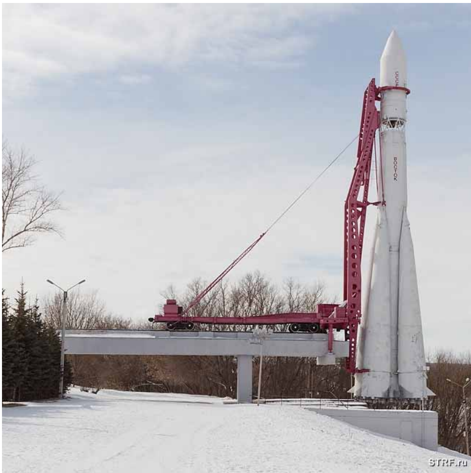
Ракета «Восток» у здания ГМИК им. К.Э. Циолковского. На такой ракете полетел в космос наш советский офицер, лётчик Ю.А. Гагарин