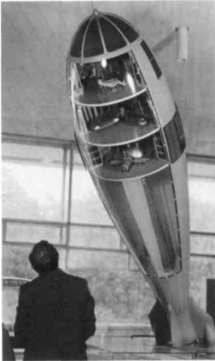
Макет ракеты К.Э. Циолковского в ГМИК (второй этаж)