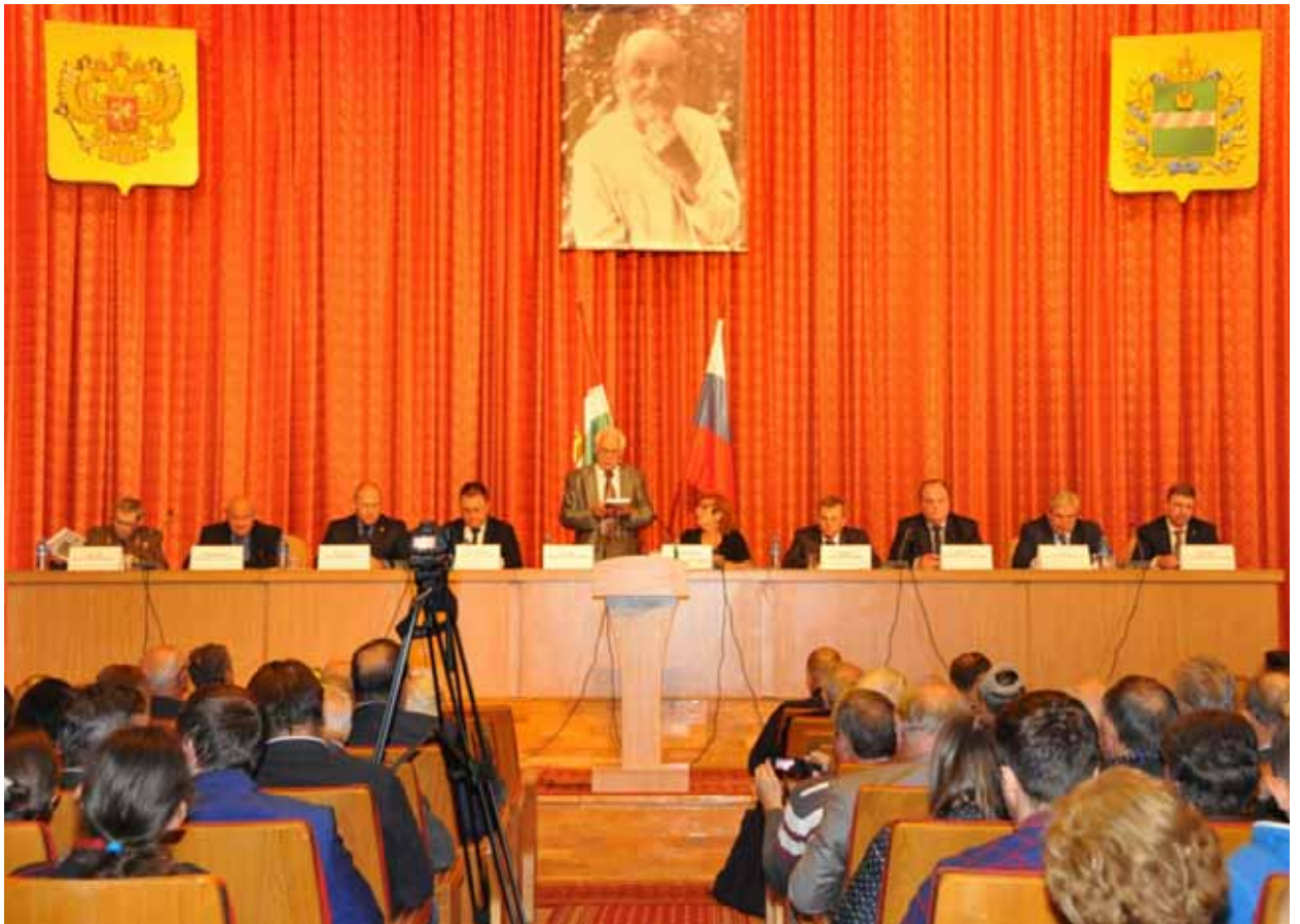
Академик М.Я. Маров открывает юбилейные 50-е чтения, посвящённые памяти К.Э. Циолковского в Калуге 15 сентября 2015 г.