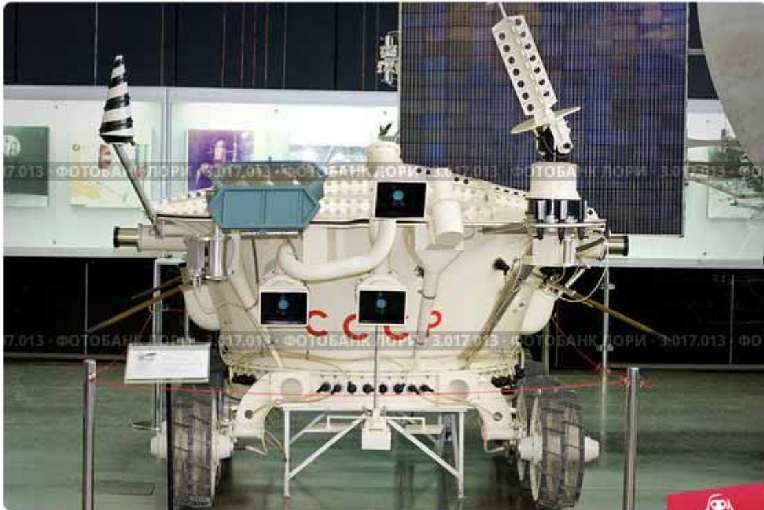
"Луноход 2" в Государственном музее истории космонавтики имени К