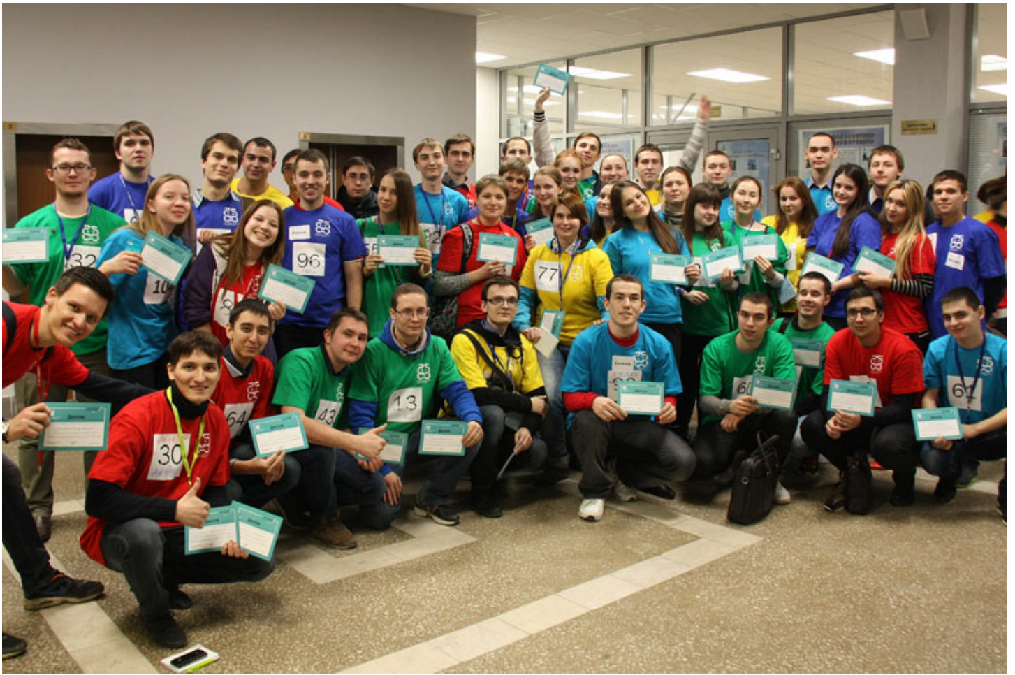
Управление внеучебной работы