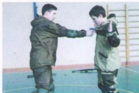
Показательные выступления представителей оперативного отряда РЦ «Форпост» (студенты КГЭУ, КНИТУ – КАИ им. А.Н.Туполева)