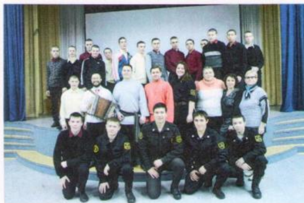
Фотографирование на память