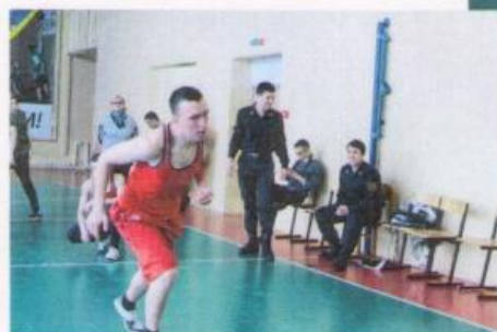
Этапы спортивных соревнований