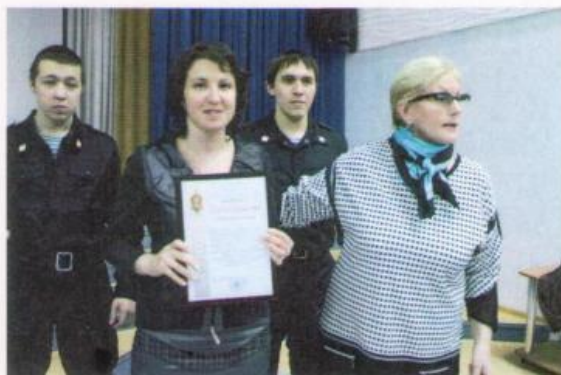
Награждение специалистов Раифского спец. училища «Благодарностями» РЦ «Форпост»