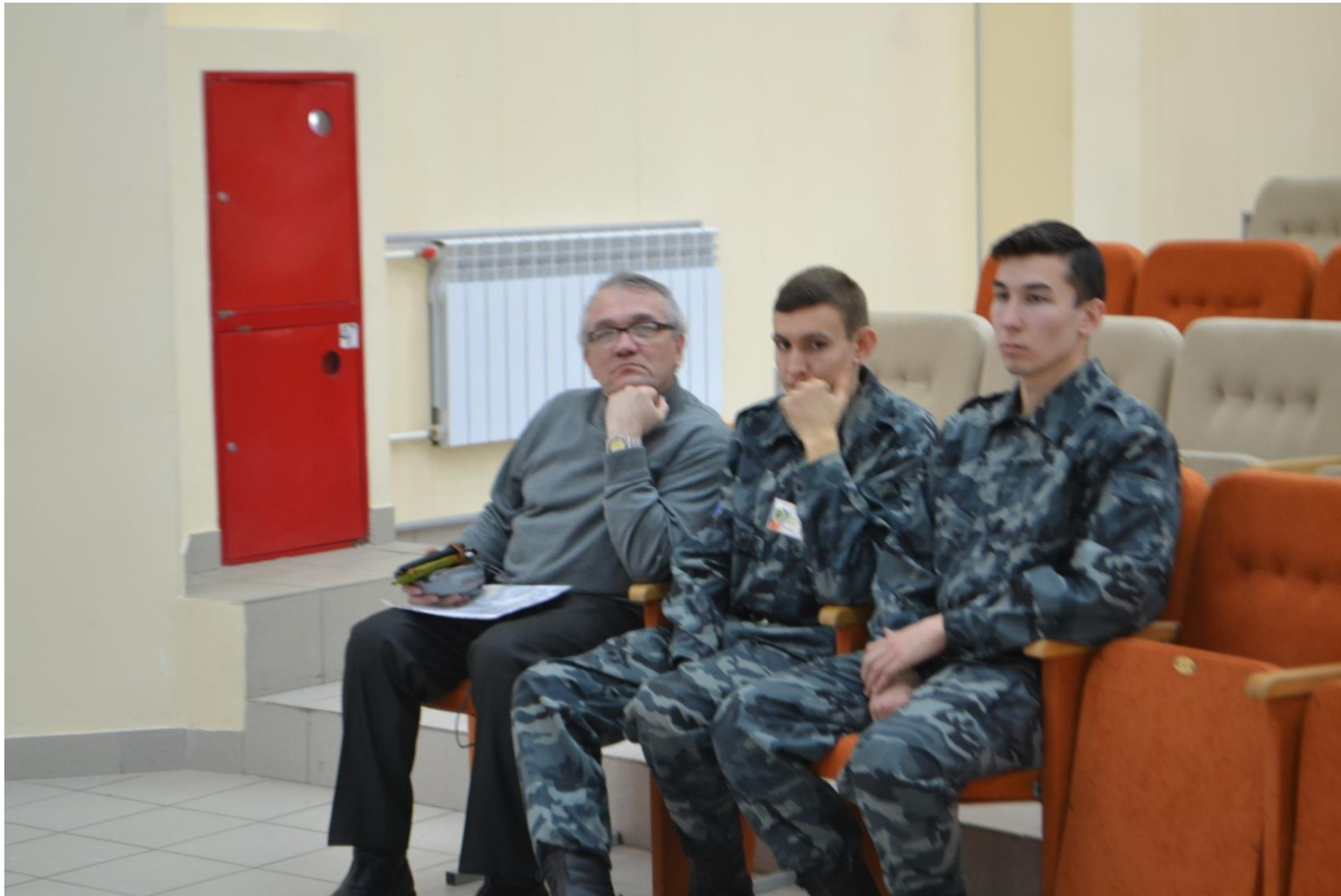
Охрана – всегда начеку!