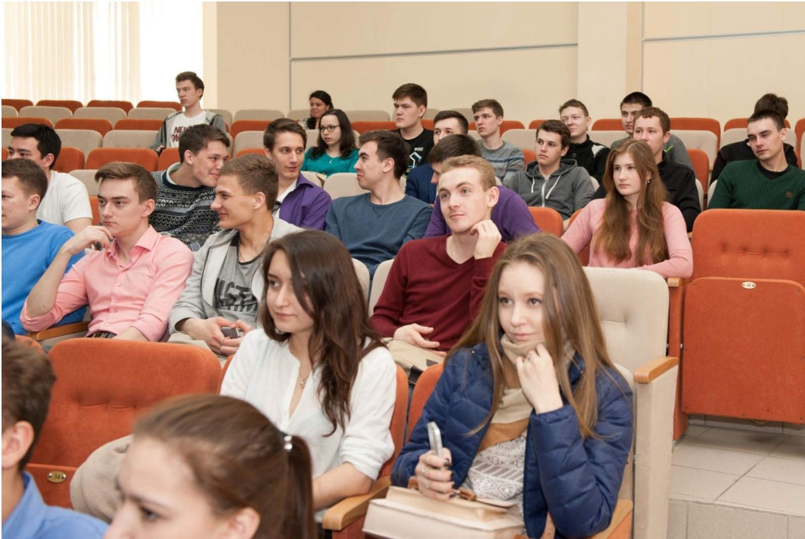
В зале «Туполев» - студенты, аспиранты, школьники, преподаватели и сотрудники КНИТУ-КАИ и др. вузов, школ и организаций г. Казани