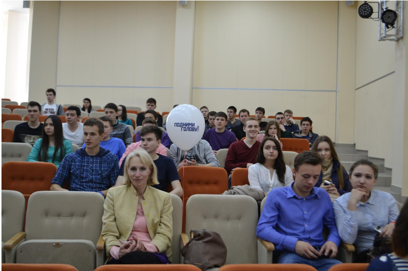
Перед просмотром фильма «Наш Гагарин»