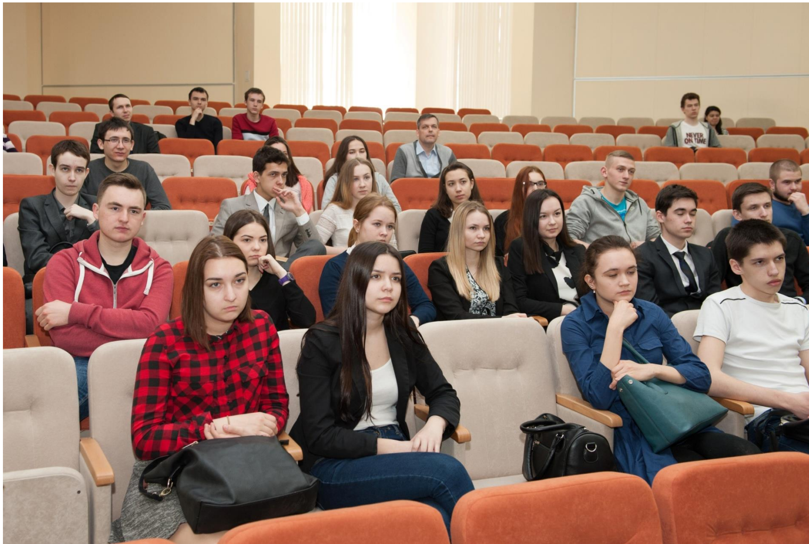
В зале «Гуполев» - студенты, аспиранты, школьники, преподаватели и сотрудники КНИТУ-КАИ и др. вузов и организаций г. Казани