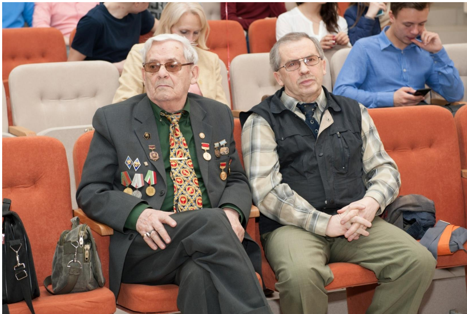
Перед просмотром фильма «Наш Гагарин»