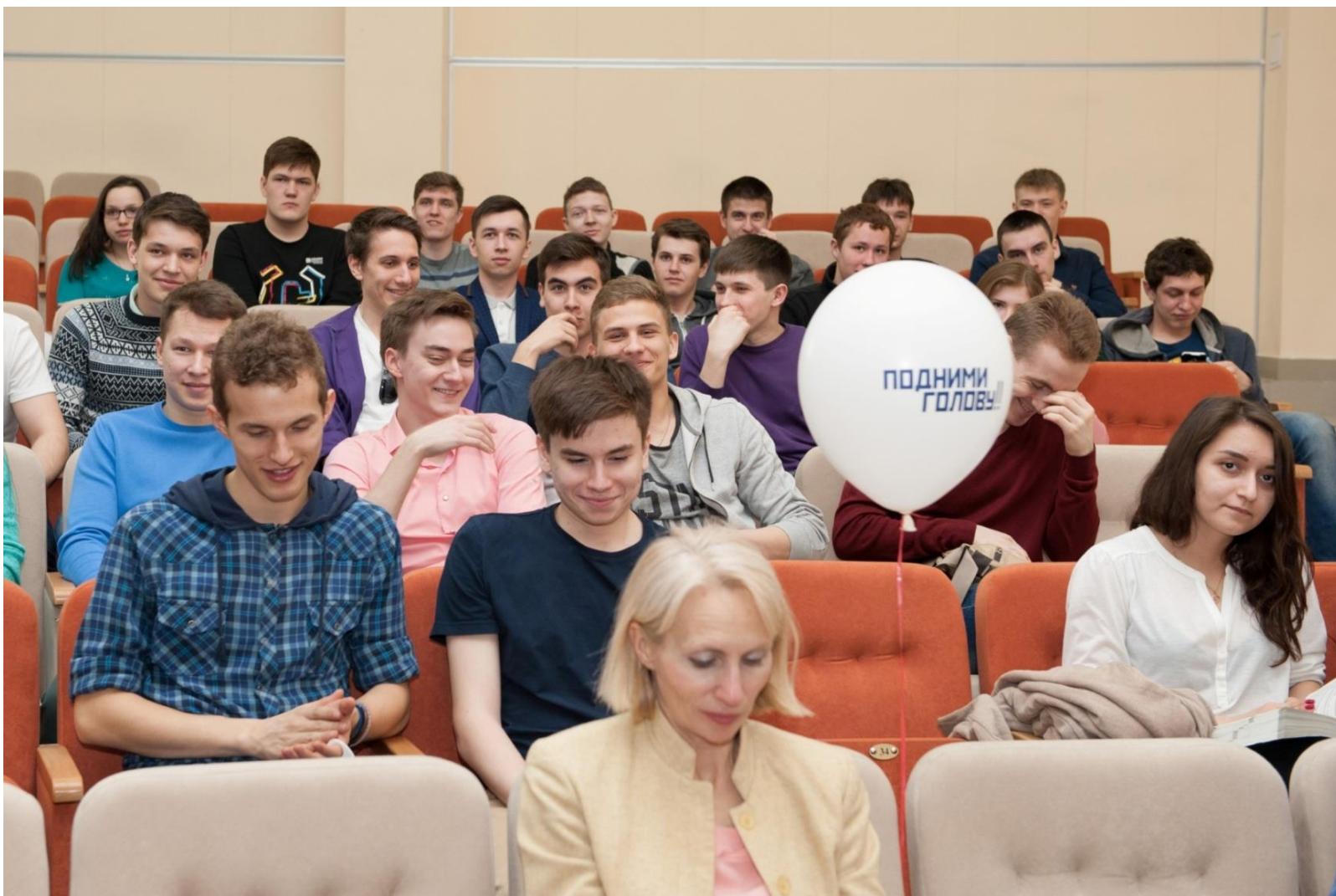
В зале «Туполев» - студенты, аспиранты, школьники, преподаватели и сотрудники КНИТУ-КАИ и др. вузов, школ и организаций г. Казани